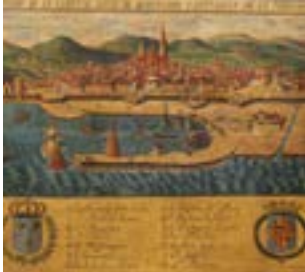
Barcelona antes del desarrollo del comercio con América (siglo XVII).

Exposición que relata la evolución de la navegación marítima catalana, del comercio por el Mediterráneo al comercio transatlántico, así como el paso de la vela al vapor. Tres siglos en los que la marina catalana se abre económicamente y socialmente a nuevos mundos.