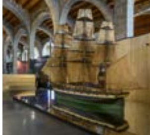
Fragata Barcelona . Modelo de enseñanza (Escuela de Náutica de Barcelona, siglo XIX).