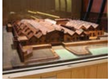
Maqueta de las Reales Atarazanas en 1880.