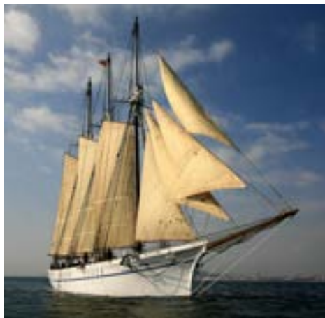
Pailebote Santa Eulàlia

El Museo Marítimo de Barcelona (MMB) nació el año 1936 y es una institución pública dedicada a la divulgación de la cultura marítima y, en especial, a la conservación, preservación y difusión del patrimonio cultural marítimo de Cataluña. El MMB está muy vinculado a la ciudad de Barcelona, tanto por su propia historia como por el edificio que lo acoge: el conjunto monumental de las Reales Atarazanas de Barcelona.