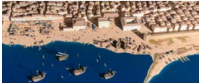
El frente marítimo de Barcelona en el siglo XV.