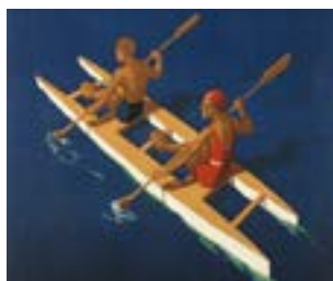
Detalle del cartel publicitario Playas de Cataluña (Josep Morell, 1940).