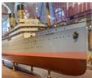
Modelo del vapor Royal Edward (Glasgow, 1907).