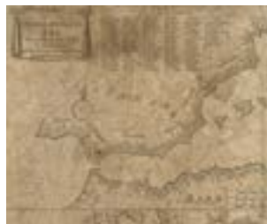
Cartografía de Pieter Goos (Amsterdam, 1673).