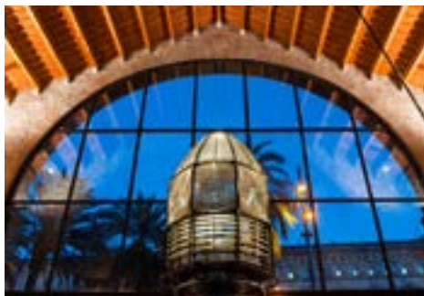
Óptica del Faro de Sant Sebastià

El conjunto monumental de las Reales Atarazanas de Barcelona tiene más de siete siglos de historia. Fue edificado en el siglo XIII para la construcción y el mantenimiento de galeras y barcos de guerra al servicio del rey de Aragón Pere el Gran. Es uno de los edificios representativos del gótico civil más importantes del mundo.