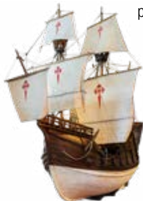
Modelo de la Nave Santa María de la Victoria (s. XVI). Fue la primera en completar la vuelta al mundo.

Siete historias explicadas por siete personajes a bordo de siete barcos que nos cuentan cuestiones universales como el descubrimiento de nuevos territorios, el mar como espacio de ocio, la vida a bordo de un transatlántico, el mar como escenario de conflictos, la mercadería, la piratería y el corso, y el cambio tecnológico. Un viaje por la historia de la navegación moderna y contemporánea.