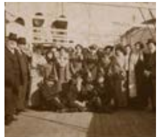
Retrato de un grupo de pasajeros en la cubierta de un transatlántico (1910).