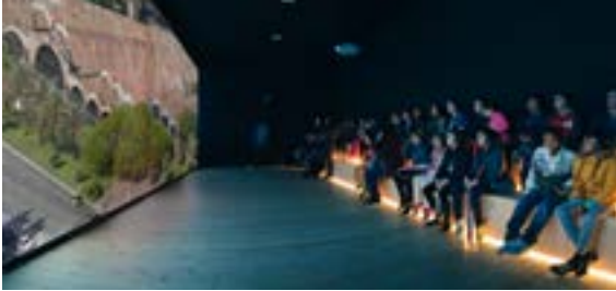
Audiovisual sobre la historia del edificio de las Reales Atarazanas.

Exposición en torno a la historia del conjunto monumental de las Reales Atarazanas de Barcelona, edificio construido al servicio de la industria naval catalana para favorecer la expansión por el Mediterráneo durante los siglos XIII-XV. Un recorrido a través del edificio, los oficios tradicionales y las galeras, y en especial, la réplica de la Galera Real.