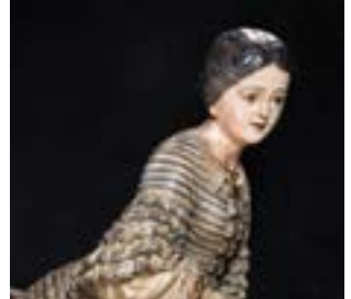
Mascarón de proa La Blanca Aurora (Lloret de Mar, 1848).