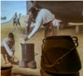
Los oficios tradicionales de mar.