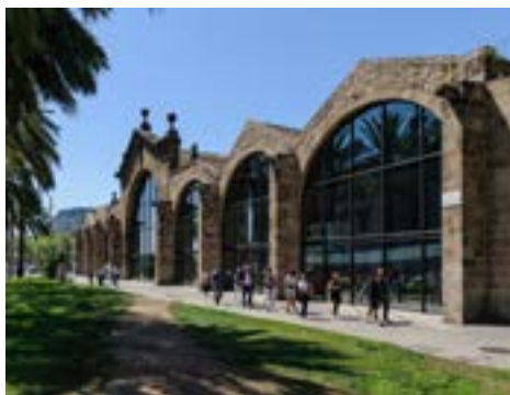
Fachada de las Reales Atarazanas

Es un velero de más de cien años que forma parte del patrimonio en el agua del Museo. Permite comprender la historia de la navegación y el comercio marítimo en nuestro país. Por su valor patrimonial e histórico, en el 2011 fue declarado Bien Cultural de Interés Nacional. El Santa Eulàlia está amarrado en el Muelle de Bosch i Alsina, muy cerca del Museo Marítimo. Se puede visitar diariamente. Los sábados por la mañana sale a navegar por el frente marítimo de Barcelona, excepto cuando participa en eventos náuticos tradicionales.