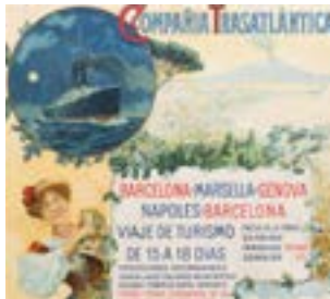
Cartel publicitario de la Compañía Trasatlántica (Ruiz, 1910).